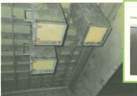
【触媒反応塔の点検】

煙突の点検にはゴンドラを使用します。煙突の頂部からワイヤーを降ろし、煙突の入口から出口に向かって登っていきます。