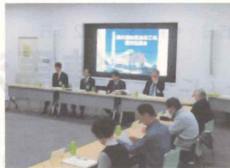
運営協議会の様子

令和7年11月10日(月)に開催した運営協議会では、工場の操業状況や環境調査結果について報告しました。排ガス調査結果とダイオキシン類調査結果は、以下のとおりです。全ての項目で基準値を満足していました。