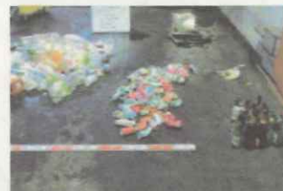
可燃ごみに混入していた びん・缶・ペットボトル