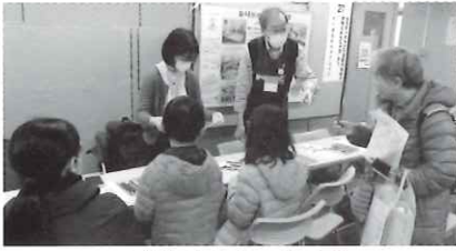
ねりまおもちゃクラブ