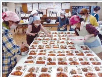
チームワーク抜群の調理風景

配達先でかけられる「おいしかったよ」の一言や、サロンに遠方から通ってくださる姿に私たちも元気をいただき「こんな風に年齢を重ねたい」と憧れを抱いています。