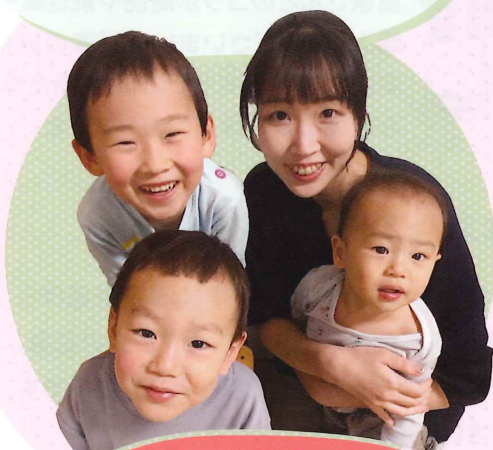
高橋さんと子ども達