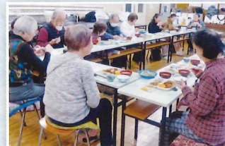
あたたかい家庭の味に 会話が弾みます