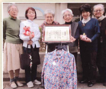
ぬいぬいの皆さん いつもありがとうございます

ぬいぬいの作品は、関町ボランティア・地域福祉推進コーナーで随時販売しています。お立ち寄りの際はぜひご覧ください。