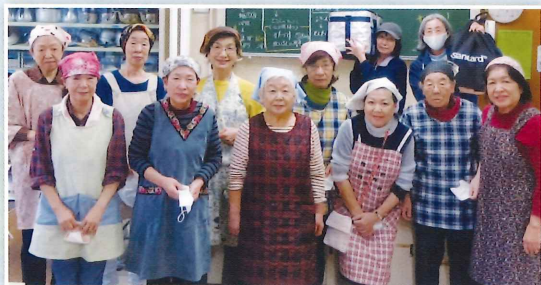
中村グループの皆さん おめでとうございます！