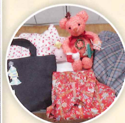
丁寧に縫われた作品