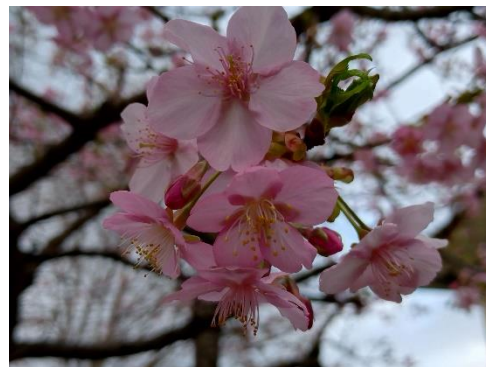
今年も長命寺の河津桜が開花、春を告げました(2月24日)