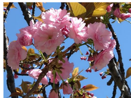
練馬高野台駅近く石神井川の桜(染井吉野)も満開で、八重桜も咲き始めました 4月8日