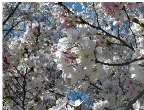
区立なんごう児童遊園の桜(染井吉野)も満開です 4月8日