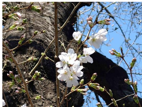
区立高野台児童遊園の染井吉野が咲き始めました(3月21日)