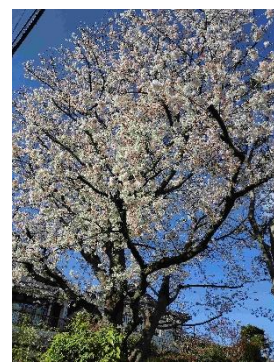
練馬区立高野台地域集会所の桜(染井吉野)が満開です(4月2日)