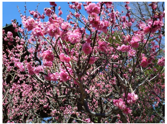
鐘撞堂近くの紅梅