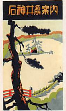
石神井名所案内 昭和8(1933)年 武蔵野郷土向上会が発行したガイドブックで、 表紙には三宝寺池が描かれています。

石神井は、練馬区内の地名で、都立石神井公園があることで知られています。三宝寺池の湧水や石神井川の流れに恵まれた地であり、人びとが水と関わりながら暮らしてきました。水の恩恵を受けて、旧石器時代から人々の生活が営まれ、中世には、石神井川流域に勢力を拡大した豊島氏によって石神井城が築かれました。近世になると、江戸近郊農村として発展するとともに、三宝寺池周辺は風光明媚な場所として、江戸の文人にも知られるようになりました。枯れることなく湧き出る水源である三宝寺池にまつられた弁天社(現巖島神社)は、石神井川下流の人々から信仰を集め、祭礼時には江戸から訪れる人々で賑わいました。また、三宝寺池には主がいると信じられており、伝説も伝わっています。