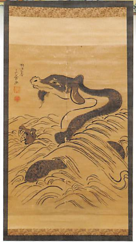
三宝寺池の主の図 明治9(1876)年 山養画 三宝寺蔵 古来より、三宝寺池には主がいると信じられていました。明治8(1875)年に山養という人物が、三宝寺池で「大蛇」を見たという人からその様子を聞いて描いたという絵です。本図を掛けて祈れば、干ばつの時に降雨がもたらされると言われてきました。