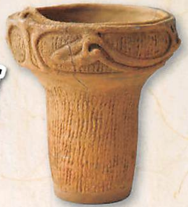
石神井出土の縄文時代中期の土器