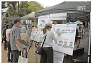
○アニメプロジェクト in 大泉への出展