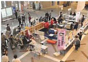
○マルシェ de 延伸大江戸線