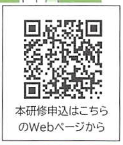
本研修申込はこちらのWebページから

研修の申込 問い合わせ先 練馬福祉人材育成・研修センター TEL:03-6758-0145 電話での問い合わせ:土日・祝休日を除く9:00~17:00