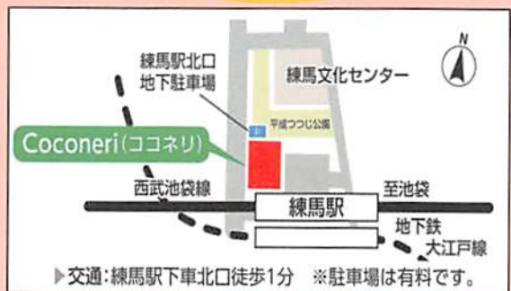
交通:練馬駅下車北口徒歩1分 ※駐車場は有料です。