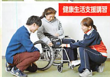
健康生活支援講習