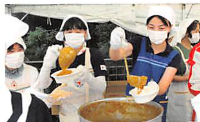
赤十字ボランティア