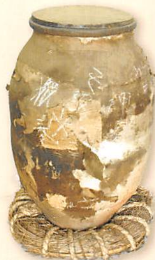
茶がめ かめの外側に湿気を防ぐための和紙が 貼られている茶の保存容器。 葉で編んだ茶がめ台に乗せられている。