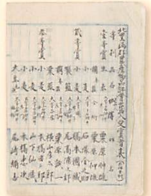
北豊島郡農産物品評会

千川上水が旧早稲田通りと交差する 八成橋付近(南田中1-22)にあった水車。 昭和戦前まで主に精穀の動力となった。