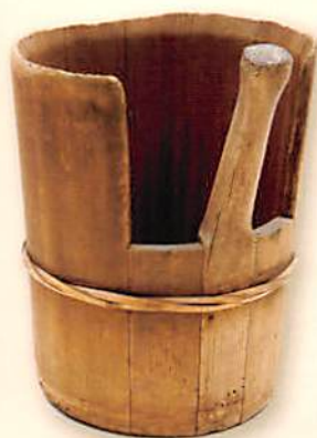
かき桶 醤油や味噌の原料である 大豆や小麦を貯蔵容器から 取り出す道具。