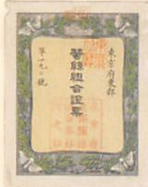
東京府東部蚕糸組合証票