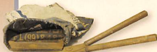
茶摘み鉋 刈り取った茶の葉を入れる集葉袋が ついている茶摘み専用のはさみ。