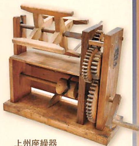
上州座繰器 繭から生糸を取る道具で、取っ手を回すと、 歯車の作用で糸巻棒が早く回転し、糸が 巻き取れるようになっている。