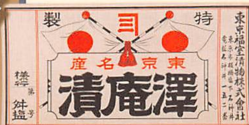
東京福室漬物株式会社 漬物樽ラベル 昭和17(1942)年頃