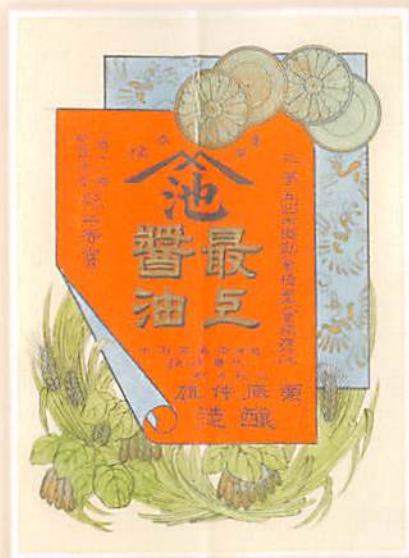
栗原醤油店 醤油樽ラベル 明治43(1910)年