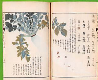
左:昭和八年秋期 三陽種苗商報第三十三号(表紙原画) 館蔵 右:本草図譜(梁部巻之四十三) 館蔵