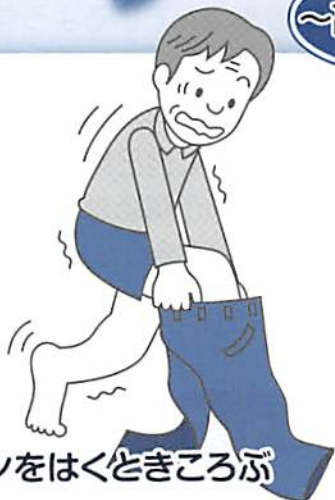
ズボンをはくときころぶ

家庭内や外出時「危なかったな」と感じたことがあればご家族などと情報共有し、対策を話し合いヒヤリ・ハットをなくしましょう