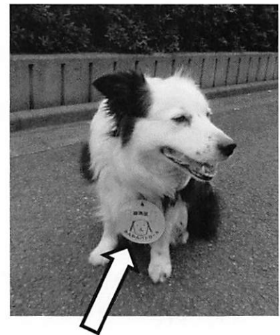
ワッペン型キーホルダー

町会有志が、子供たちの登下校時を中心に犬の散歩を兼ねた 《わんわんパトロール》を行っています。