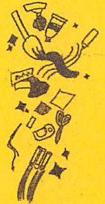
6年 櫻庭 凜