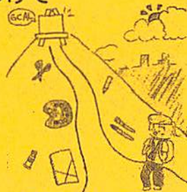
5年 梶山 千咲