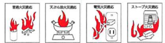
住宅用消火器の適応火災表示例