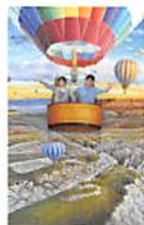
カッパドキアの夢景色