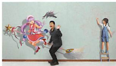
飛び出す魔法少女