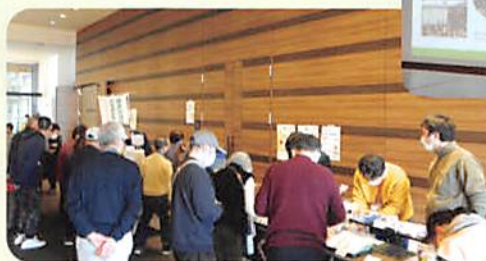
福祉作業所のオリジナルグッズ販売会