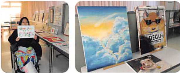
(向かって左)かたくりから企業に就職した人の花文字や、(向かって右)交流のある大泉桜高校の美術部の作品も出展していただきました

が地域に支えられていると実感できる素敵なギャラリーになりました。来所者のみなさまには、「一つひとつ個性があって、すばらしい作品でした」という感想をいただきました。