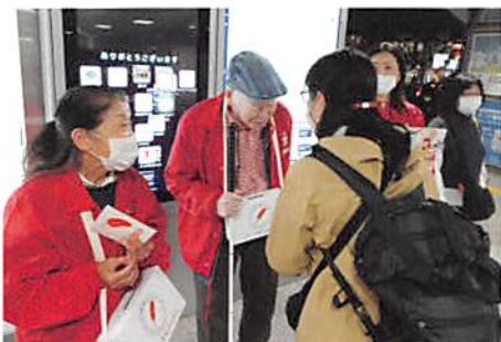
練馬駅での街頭募金の様子

共同募金は、地域でともに暮らす人たちのために役立ててほしいという思いが込められた寄付金です。民間福祉施設の環境支援、子育て支援、障害者の自立支援のための事業のほか、私たち練馬区の地域福祉を推進していく事業費として配分されます。町会・自治会、民生・児童委員の方や商店街など、たくさんの方々にご協力いただきました。また、今年度は地域の方々にもご参加いただき街頭募金を実施することができました。