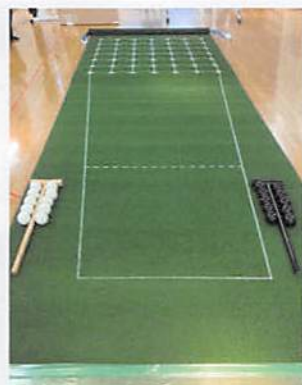
囲碁ボールセット一式

練馬囲碁ボール普及会は、練馬区内の高齢者の『健康長寿・見守り活動・人との繋がり・フレイル認知症予防・居場所づくり』の一環として、新しいスポーツ活動を提供する団体です。囲碁ボールをきっかけに「外出したい、楽しく身体を動かしたい」と感じてもらえるようにと日々活動されています。