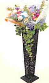
練馬区社協 会員の集い

当日は、「令和6年能登半島地震災害義援金」の募金箱を設置しました。みなさまにご協力いただきありがとうございます。また、今回の出演料はご意向により、『令和6年能登半島地震災害義援金』として寄付させていただきました。