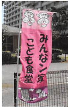
ピンクの旗がトレードマークです

毎月第4土曜日に、同じ地域にある光が丘福祉園をお借りして、「みんなでごはん」と「おたのしみ会(季節の行事)」を開催しています。「みんなでごはん」では、スタッフやボランティアが作ったおいしいごはんを、みんなで「いただきます」をして食べています。こどもや保護者だけでなく、地域に住む大人も