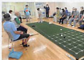
囲碁ボール プレイ中の様子

囲碁ボールは、ゲートボールとオセロゲームを掛け合わせた、老若男女・児童・障害のある人に楽しく喜んでいただける手軽なスポーツです。また、手足の動作や戦略性でも脳を働かせる事で、フレイル予防にも役立ちます。今回用具一式を購入でき、みなさまのイベントや各施設の事業等に参加しやすい環境が整いました。多くの参加者に喜んでいただけるよう、より一層まい進いたします。