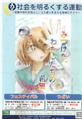
ポスターは毎年公募を行っています

練馬区保護司会は法務大臣により委嘱された保護司で構成され、犯罪や非行をした人の立ち直りを助けるとともに、犯罪予防の活動に取り組んでいる更生保護のボランティア団体です。『社会を明るくする運動』は、犯罪や非行のない安全で安心な明るい地域社会を築くための全国的な運動です。