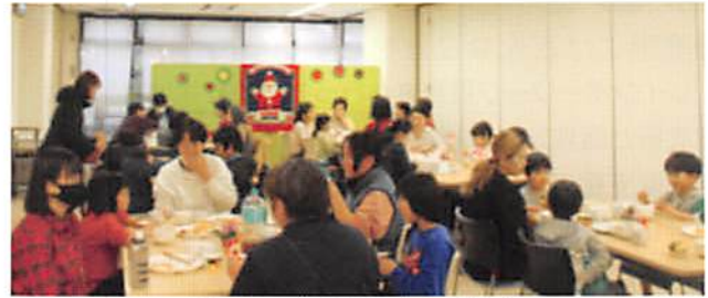
みんなで食べるおいしいごはん

食事やおしゃべり、フードバンクでのかかわりなどを通じて、互いに支え合い安心できる居場所にもなっています。