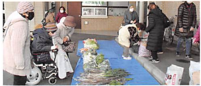
農家さんから譲り受けた野菜も販売しています

みんな家は、光が丘2丁目の地域を中心にこども食堂やフードバンクを行うグループです。こどもの貧困やひとり親家庭、ひとり暮らしの大人が増えていることをきっかけに、こどもが健やかに育ってほしい、食を通して生きる力を持ってほしい、顔見知りを作ってほしいという思いから始まりました。