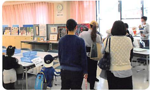
たくさんの地域の人にご来所いただきました

12月9日(土)に「大泉☆かたくりギャラリー」を開催しました。このギャラリーは地域講座の一環で、かたくり福祉作業所を知ってもらうとともに、地域との交流を図ることも目的としています。作業として取り組んでいる『KATAKURI ART』の作品と近隣の学校や施設、ボランティアのみなさまの作品も展示することができました。改めて、かたくり福祉作業所