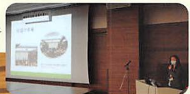
練馬区社協事業説明の様子