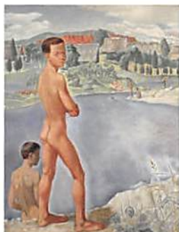
《水浴》1941年 油彩、カンヴァス 練馬区立美術館蔵