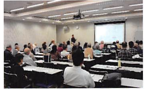
▲毎回好評の【歴史と文化講座】

南田中のまちを考える会は、平成21年5月立ち上げ、この14年、①南田中のまちづくり活動、②3つの小学校の社会科授業支援、③南田中まちニュースの発行、④【歴史と文化講座】開催、⑤南田中のまち歩き、⑥南田中のガイドマップの作成などの活動を行って来た。今回の【SDGs】は、地元練馬で平成21年5月より持続的可能な活動として続けている南田中のまちを考える会が【歴史と文化講座】のまちづくりを持続するSDGsを取り上げることにした。練馬区で12番目の図書館が出来たのを機会に、南田中地域の「よりよいまちづくり」を、この15年間続けて行っている。