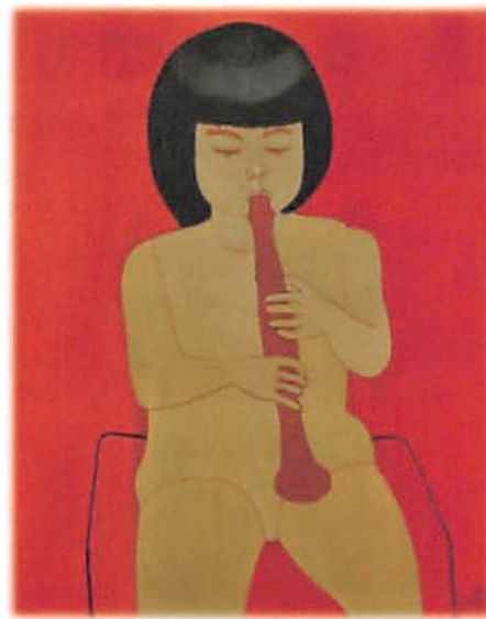
《笛を吹く童女》1978年 油彩、カンヴァス 個人蔵

会期 練馬区立美術館 休館日 2023年4月29日(土・祝)～6月18日(日) 開館時間 月曜日 観覧料 10:00～18:00 ※入館は17:30まで 一般1,000円、高校・大学生および65～74歳800円、中学生以下および75歳以上無料※障害者手帳をご提示の方(介添者1名まで)は、一般500円、高校・大学生400円※一般以外の方(無料・割引対象者)は、年齢等が確認できるものをお持ちください。 主催 練馬区立美術館(公益財団法人練馬区文化振興協会) イベント 練馬区立美術館で講演会やワークショップ等の展覧会関連イベントを実施します。