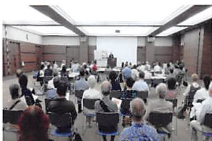
▲仲間と親しくシニアセミナー

方々で、地域の同世代の仲間と「活動の足場」「居場所づくり」「過去の経験を生かした自己完成」のきっかけ作りをしていただ