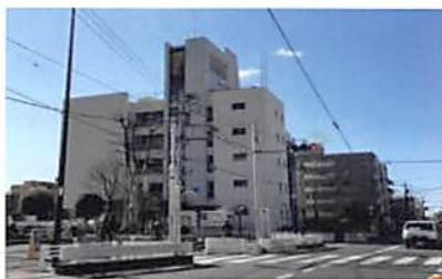
▲築51年で老朽化した石神井庁舎