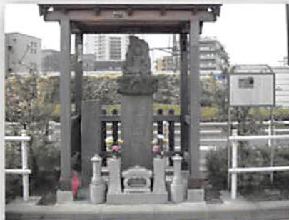
▲かつてふじ大山道との分岐点にあった道標

この道を最初に整備したのは中世の武将・太田道灌で、当時は自己の拠点であった江戸城と主君・扇谷上杉家本拠の川越城を結ぶ「軍用道路」として機能させていたと考えられる。道灌にとってまさにこれは「生命線」ともいえる通路だったようで、1477（文明9）年、練馬付近を支配していた豪族・豊島氏も道灌と戦う直前にはまずこの街道の封鎖を行っており、また道灌もそれにより開戦を決意しているのである。さらには翌年、道灌は平塚城（北区上中里）に籠る豊島一族を攻撃に行く際にもこの道を利用し、膝折（朝霞市）経由で到達している。ただし、その時代の道筋は、江戸期のものとは大きく異なっており、下赤塚付近からは大きく北に逸れて城山～岡城（朝霞市）～宗岡宿（志木市）を通過していた可能性が高い。