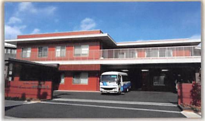
開館した Leaves 練馬高野台 建物全景

事業に、この3つの事業を含めることにより、日常生活に困難を抱える方の地域生活の充実を図る。