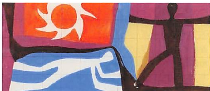
《人と太陽》(旧国立競技場壁画原画下図) 1964年頃 鉛筆、グアッシュ、紙 個人蔵

この展覧会では都内3カ所の映像を撮影し、展示室内で放映、その原画と共に展示を行う。