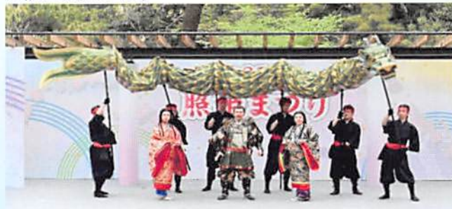
▲昨年の「照姫まつり」のステージ

後を迎えるが、実は平塚城（北区）へと難を逃れ再起を図ったとの記録も残されている。石神井城落城の歴史と照姫伝説とを整理して紹介しているが石神井城落城の歴史と照姫伝説を踏まえ、更に深く照姫まつりの物語を楽しんでいただければとの願いを込めて催されている。