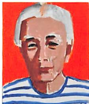
《自画像》1996年 油彩、カンヴァス 個人蔵

本展では生誕120年という記念の年にあたって、これまで紹介してきた作品に加え、作画の原点であるスケッチ類や三之助作品を含む新収蔵品、調査の中で新たに発見された作品、ことに1980～90年代にかけての晩年の抽象画を含めた約120点で大沢芸術の豊かさを多面的に紹介する展覧会です。