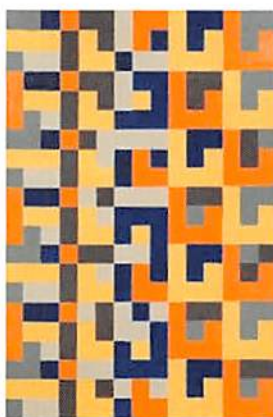
《変わっていく繰り返し》 1981年頃油彩、カンヴァス 練馬区立美術館蔵