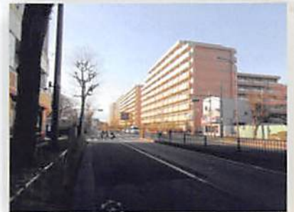
▲川越街道の新道(右手は北町交番)

長く賑わいを見せていた街道だったが、やがてそれも新河岸川の舟運が発達すると、次第に廃れていく。さらに明治期、「白子乗合馬車」（白子村～板橋～万世橋～浅草雷門）、「東京川越間乗合馬車」（東京～川越）、「白子軽便乗合馬車会舎」（白子～板橋間）などが発足すると徒歩旅行者は激減、そして1914（大正3）年、川越街道に沿って池袋～田面澤（川越の入間川東岸）間で東上鉄道（現・東武東上線）が開通すると、徒歩・馬車・船便の時代はいずれも完全に終わりを迎えることとなった。