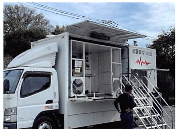
(起震車による体験)

答えは、災害時のトイレ使用回数の目安は一日5回(個人差あるが)と計算し一週間で35回分が必要との事です。(内閣府防災担当ガイドラインより)