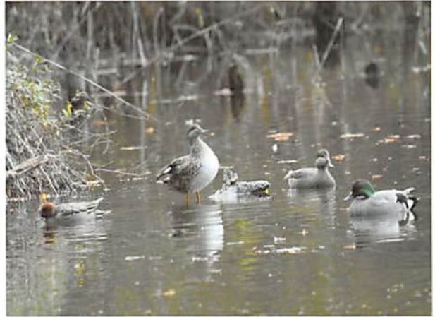
ヒドリガモ オカヨシガモ ヨシガモ

生存競争を生き抜く野鳥達の生態を、葉が落ち視界の開けた公園で、じっくり観察してください。一方で野鳥達にとって冬は恋の季節の始まり。派手な色彩に抜け替わったカモの雄たちが懸命に繰り広げる求愛にも注目です。1年のうちで最も野鳥観察を楽しむことができるベストシーズン、防寒対策をお忘れなくお出かけください。