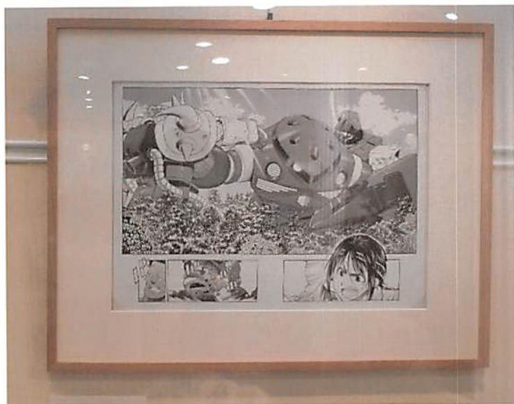
原画「機動戦士ガンダム 赤い三巨星」

練馬区立石神井公園ふるさと文化館では、令和6（2024）年1月から分室にて練馬区ゆかりの漫画家の紹介をしています。漫画「JIN」の作者である村上もとか館長をはじめ、練馬区内にはたくさんの漫画家が住んでいらっしゃいます。3ヶ月ごとに2人の漫画家を紹介し、原画や漫画本などを展示しています。本誌では、ふるさと文化館分室で過去に作品展示を行った漫画家を紹介しています。