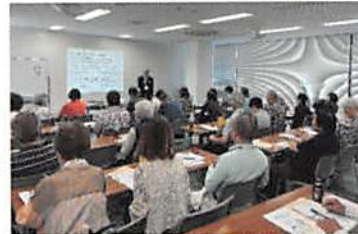
▲「ねりまシニアライフ講座」の様