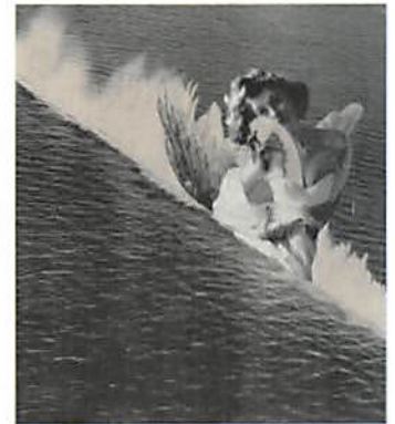
岡上淑子 海のレダ 1952年 個人蔵