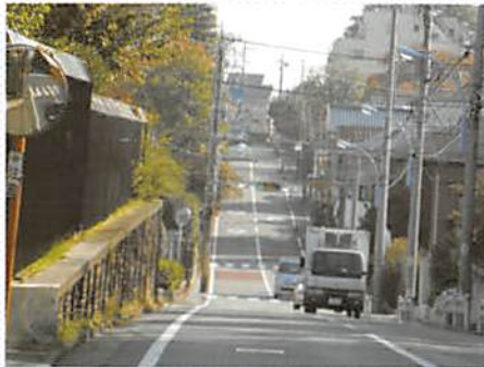
▲今川の太田道灌布陣伝説地(向かいの丘上付近)

「道灌山」という地名が残されている(現在「幕陣」の西側は「道灌公園」として整備されている)。