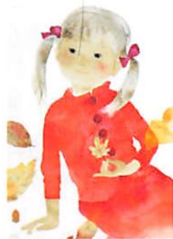
いわさきちひろ 枯れ葉と赤い服の少女 1971年