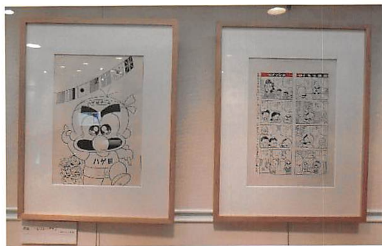
原画「つるピカハゲ丸」

平成11(1999)年、『赤マルジャンプ』1999WINTERにて読切『CHILDS』でデビュー。以降読み切りを重ね、平成18(2006)年に『週刊少年ジャンプ』で卓球を題材にした『P2! - let's Play Pingpong! -』で初連載を開始。令和5(2023)年から令和7(2025)年まで、月刊ガンダムエースにて『機動戦士ガンダム 赤い三巨星』（シナリオ：関西リョウジ）を連載した。