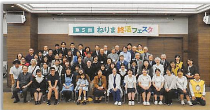
▲第5回 ねりま終活フェスタ—全員写真

練馬区補助金事業「相談情報ひろば」、「食のほっとサロン」子ども食堂、男性料理教室、子育て世代対象の「みんなで晩ご飯」練馬区協働ラボ事業「みんなで楽しく終活ボードゲーム」玄米粉のシフォンケーキ販売など行っています。