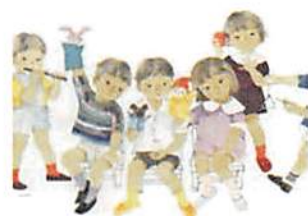
いわさきちひろ 指人形で遊ぶ子どもたち 1966年