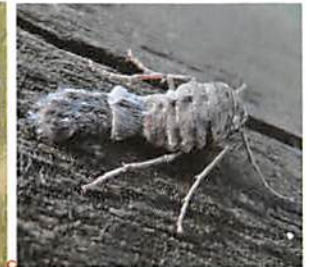
ホソミイトトンボ ホソミオツネトンボ シロオビフユシャク(左メス、右オス) ウスバフユシャクの産卵