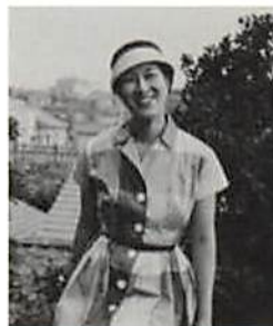
ワンピースにクロッシェを合わせた装いで 1956年

入館料：大人1200円／高校生・18歳以下無料／団体（有料入館者10名以上）、65歳以上、学生の方は900円／障害者手帳ご提示の方とその介添えの方（1名）は無料／年間パスポート3000円