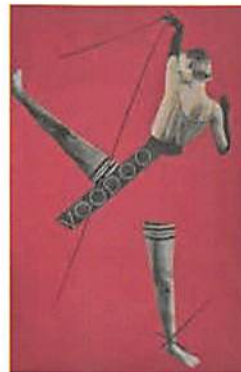
岡上淑子 ポスター 1950年 東京国立近代美術館蔵