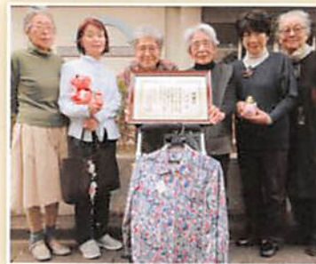
ぬいぬいの皆さん いつもありがとうございます

ぬいぬいの作品は、関町ボランティア・地域福祉推進コーナーで随時販売しています。お立ち寄りの際はぜひご覧ください。