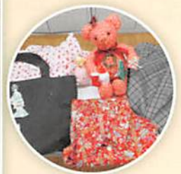
丁寧に縫われた作品