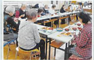
あたたかい家庭の味に 会話が弾みます