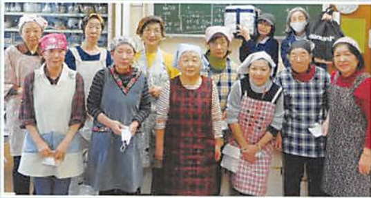
中村グループの皆さん おめでとございます!