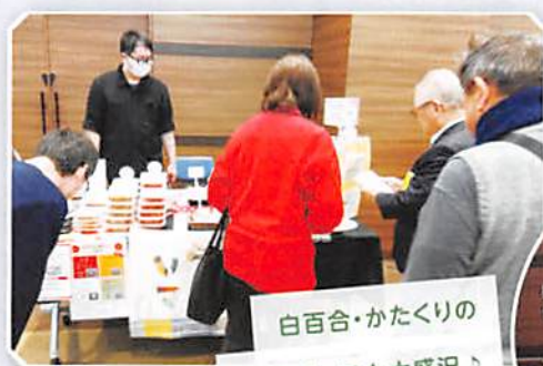
白百合・かたくりの 販売ブース也大盛況♪