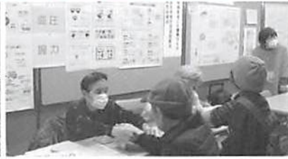
東京保健生活協同組合練馬協議会