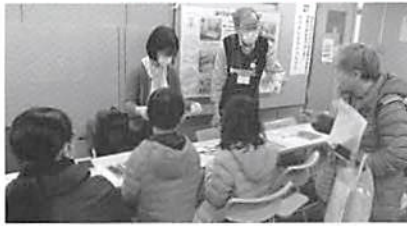
ねりまおもちゃクラブ