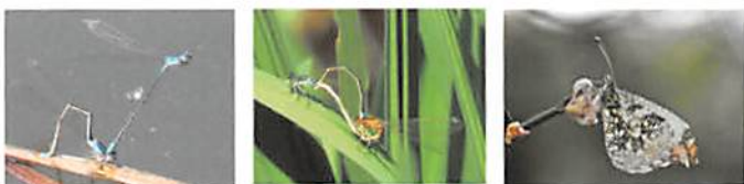
ホソミイトンボ アジアイトンボ ツマキチョウ

トンボ王国の当公園では成虫越冬したホソミオツネトンボ、ホソミイトンボが体色を鮮やかな青色に変えて繁殖行動をします。カキツバタの群落には、アジアイトンボ、少し遅れてアオモンイトンボみられます。