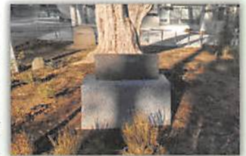
▲錦華学院内に残る「御馬ノ碑」

ちなみに、納骨堂の「聖恩山霊園」は、1919（大正8）年に設立された財団法人助葬会（現・社会福祉法人東京福祉会）が1921（大正