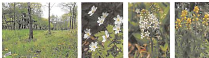
水辺観察園 4月 ニリンソウ ミツガシワ キンラン

サクラは多種類あり、カンザクラから始まり、ソメイヨシノ、野生のヤマザクラ、オオシマザクラ、遅れて石神井池南側のカンザン、シダレザクラ、フゲンゾウが次々に楽しめます。