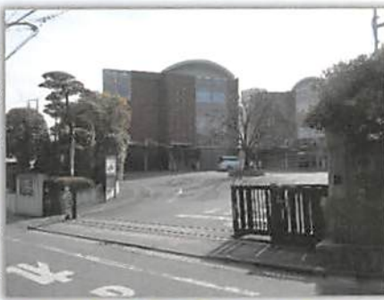
▲かつて「おみたらし」があった江古田斎場入口付近

その北側の、江古田斎場の駐車場付近には、かつて「おみたらし」と呼ばれていた小さな湧水池があり、富士講が行われていた当時（戦前まで）は代参者がここで精進潔齋を行っていた。