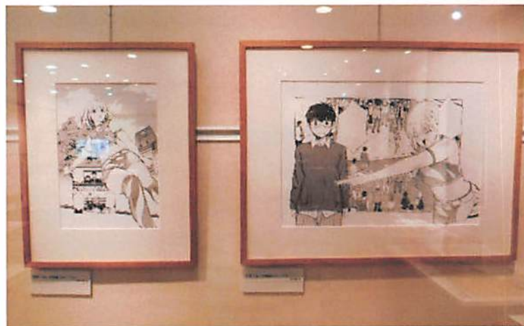
原画「ヨシダ檸檬ドロップス」

昭和61（1986）年に『花とゆめ』（白泉社）でデビュー。平成12（2000）年よりフリーになり新書館や秋田書店KADOKAWAなどでも執筆を始める。代表作は『ミッキー&一也シリーズ』『そりゃないぜBABY』『カードの王様』『NIGHT HEAD』『YELLOW』『ホス探へようこそ』。