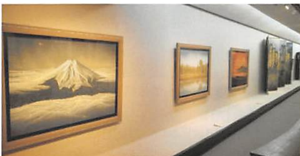
▲整然と展示された美術品の数々