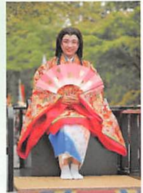
▲ 昨年の照姫まつりパレード

石神井公園周辺は歴史と伝説にゆかりの地が数多くあり、石神井城址を始めとし史跡めぐりも楽しみの一つである。