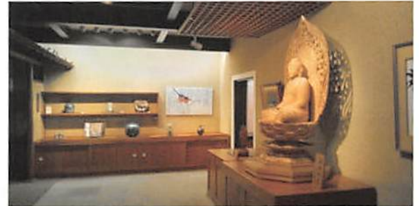
▲彫刻や仏像などの展示