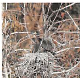
カワウ・ヒナへの給餌