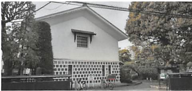
▲前面道路から見た【光が丘美術館】