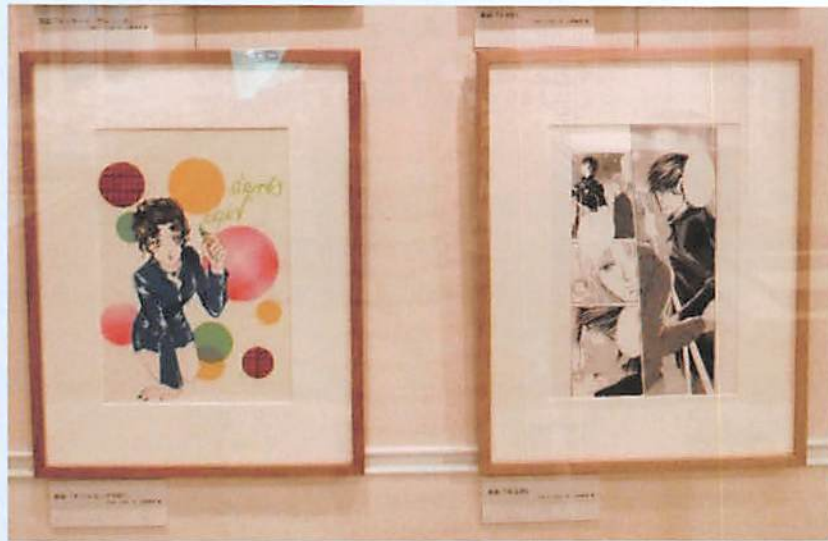
左：原画「そりゃないぜBABY」 右：原画「YELLOW」

練馬区立石神井公園ふるさと文化館では、令和6（2024）年1月から分室にて練馬区ゆかりの漫画家の紹介をしています。漫画「JIN」の作者である村上もとか館長をはじめ、練馬区内にはたくさんの漫画家が住んでいらっしゃいます。3ヶ月ごとに2人の漫画家を紹介し、原画や漫画本などを展示しています。本紙では、ふるさと文化館分室で作品展示を行った漫画家を紹介しています。