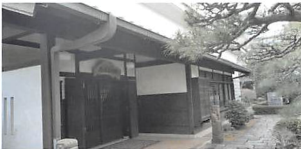
▲純和風の表玄関全景