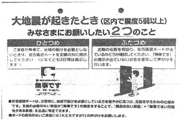
<安否確認ボード（裏）>