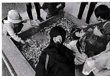
応援団まつり「スーパーボールすくい」