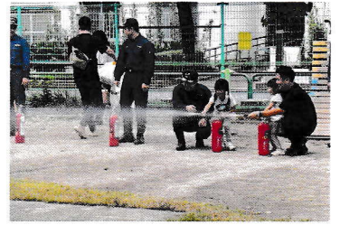
防災体験学習会での消火体験

防災会の活動に加え、毎年開催している防災体験学習会「あそぼうさいまなぼうさい」では、初めて360名の地域住民の参加がありました。