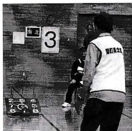
輪投げ大会でビブス着用