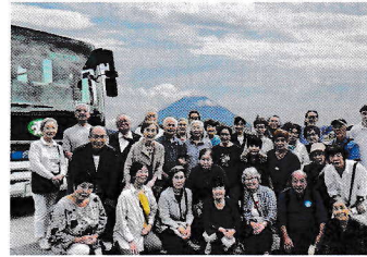
2025バス旅 山梨満喫ツアー

親睦活動としては、井口農園でのじゃがいも掘り、山梨へのバス旅行、お楽しみ会でのジャグササイズ、5町会での輪投げ大会など、従来の交流行事も多くの皆さまにご参加いただき、地域のつながりを深める機会となりました。