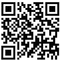
町会 HP QRコード

ました。若い世代の参加を促すため、町会案内や掲示板での呼びかけに加え、練馬区区民協働交流センターの支援をうけ、町会PR動画の作成にも取り組んでおります。