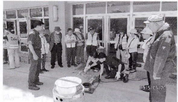
6月20日(土) 開三小避難拠点