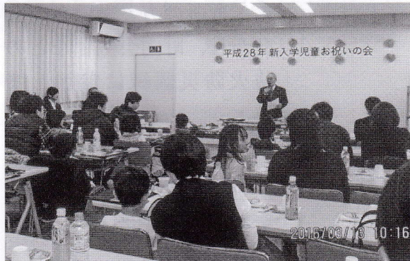
登校・下校の際は町ぐるみで “ピカピカの一年生”を見守りましょう

練馬警察署交通安全課・生活安全課より「入学児童の交通安全と防犯のお話し」がありました。