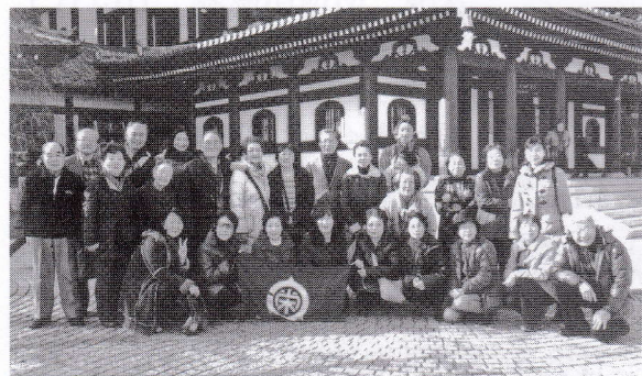
江の島・鎌倉バス旅行