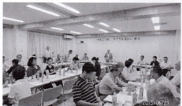
6月29日(月) 栄町防災会総会