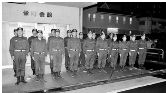
29日の消防団長激励に参集してくれた団員