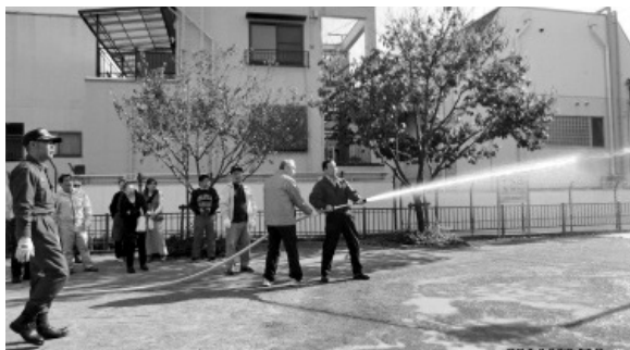
さくら児童公園にて