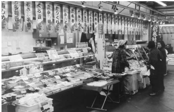
お正月用品売り出しの様子