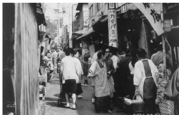
昭和42年頃