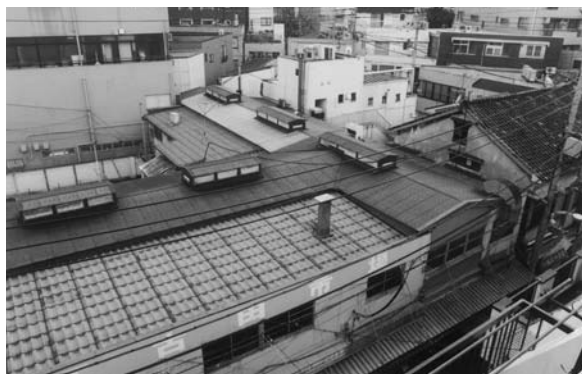
上から見た江古田市場

私たちが長年見慣れた建物は昭和33年に建てられ、肉屋・天ぷら屋・雑貨屋・おもちゃ屋・漬物惣菜屋・乾物菓子屋・味噌屋・貝屋・せともの屋・下駄屋・海苔屋・果物屋・飴屋・八百屋・魚屋などがありました。