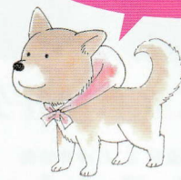
はしもと先生の愛犬モチ 大漫会にも参加していた「色紙」より ©はしもみつお

ふるさと文化館と分室でQRコードを読み込むと、本展に原画を出品している魚戸おさむ先生、はしもみつお先生、村上もとか館長の描き下しイラストがダウンロードできます