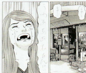
原画「ひよっこ料理人」より「DISH5：憧れて手煮鍋」石神井公園のポート池を描いたコマ ©魚戸おさむ/小学館