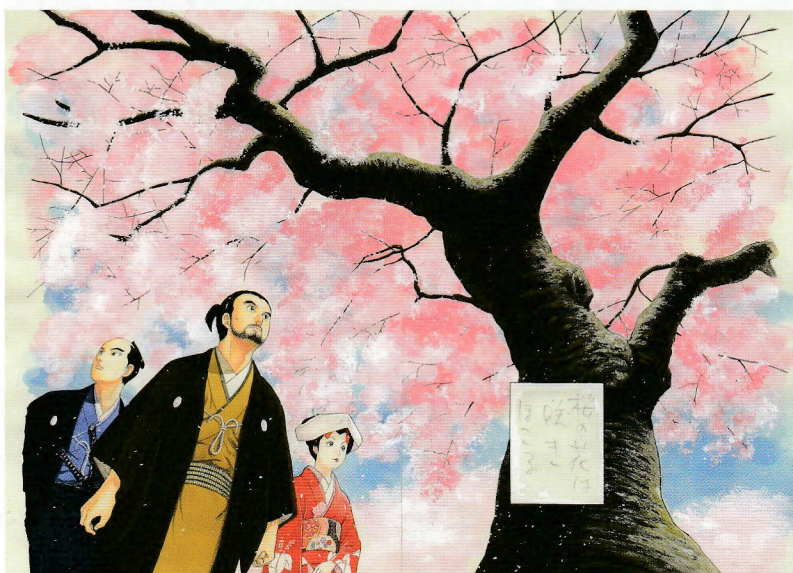
原画「JIN-仁」より「診の章4 桜」石神井公園の桜をモデルにしている ©村上もとか/集英社