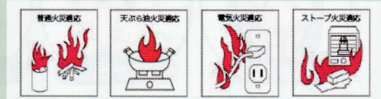
住宅用消火器の適応火災表示例