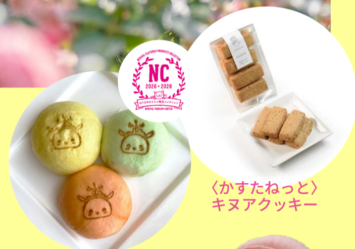
〈かすたねっと〉 キヌアッキー

開園10周年を記念してマーケットでは新しいオリジナルグッズの販売、カフェではローズソフトをバラの形にリニューアル♪