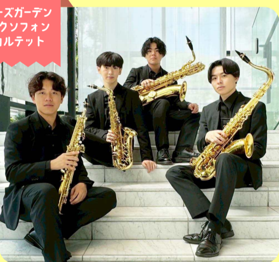
ローズガーデン サクソフォン カルテット