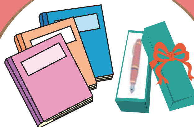
入学祝い・ 卒業祝い