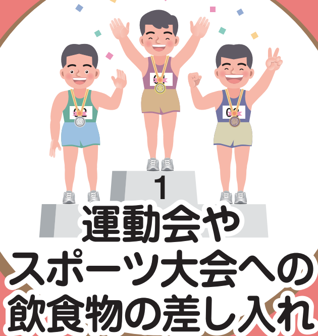
運動会や スポーツ大会への 飲食物の差し入れ