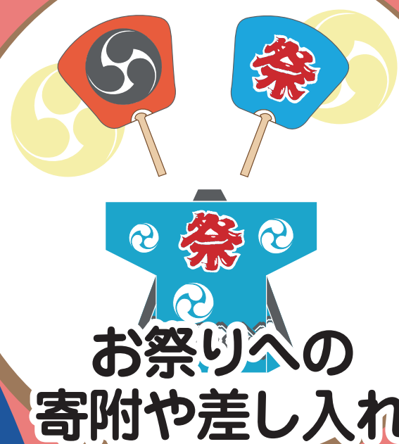
お祭りへの 寄附や差し入れ