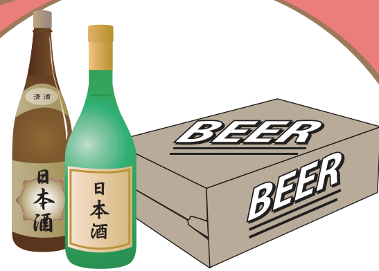
町会の集会や旅行等の 催し物への寄附や 飲食物の差し入れ