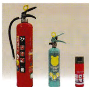
※左から消火器、住宅用消火器、エアゾール式簡易消火具