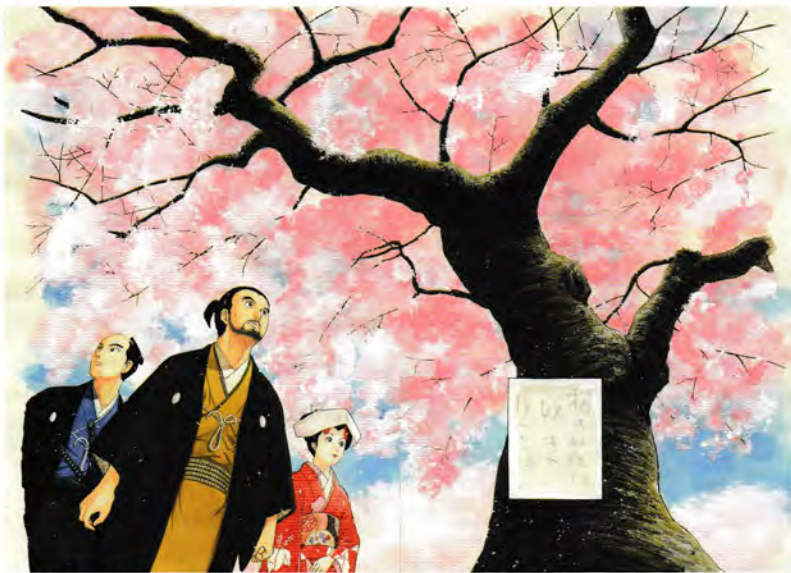
原画「JIN-じ」より「診の章4 桜」石神井公園の桜をモデルにしている ©村上もとか/集英社