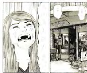
原画「ひよっこ料理人」より「DISH5：憧れて芋煮鍋」石神井公園のポート池を描いたコマ ©魚戸おさむ/小学館