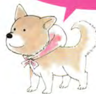
はしもと先生の愛犬モチ 大漫会にも参加していた「色紙」より ©はしもとみつお

ふるさと文化館と分室でQRコードを読み込むと、本展に原画を出品している魚戸おさむ先生、はしもとみつお先生、村上もとか館長の描き下しイラストがダウンロードできます