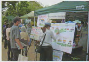
○アニメプロジェクト in 大泉への出展