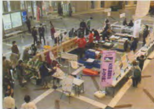
○マルシェ de 延伸大江戸線

▲令和5年12月6日(水)と7日(木)に区役所アトリウムで「マルシェ de 延伸大江戸線」を開催し、延伸地域の魅力とともに延伸計画を周知しました。2日間で延べ1,200人以上の方にご来場いただきました。