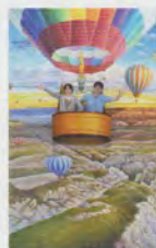
カッパドキアの夢景色