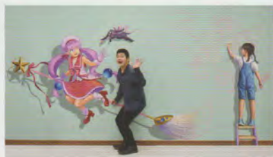
飛び出す魔法少女