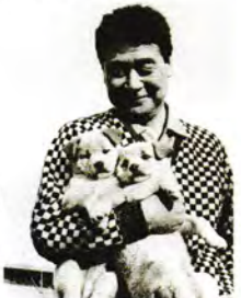
哲子と豚子を抱く草野心平 1965年頃/ ※草野心平は区内4校の校歌の作詞を手がけました。

日時: 2月8日(水)、3月4日(土) 各回14時から30分程度 定員: 各回90名 参加費: 無料 会場: 石神井公園ふるさと文化館1階 多目的会議室 申込: 当日先着順受付