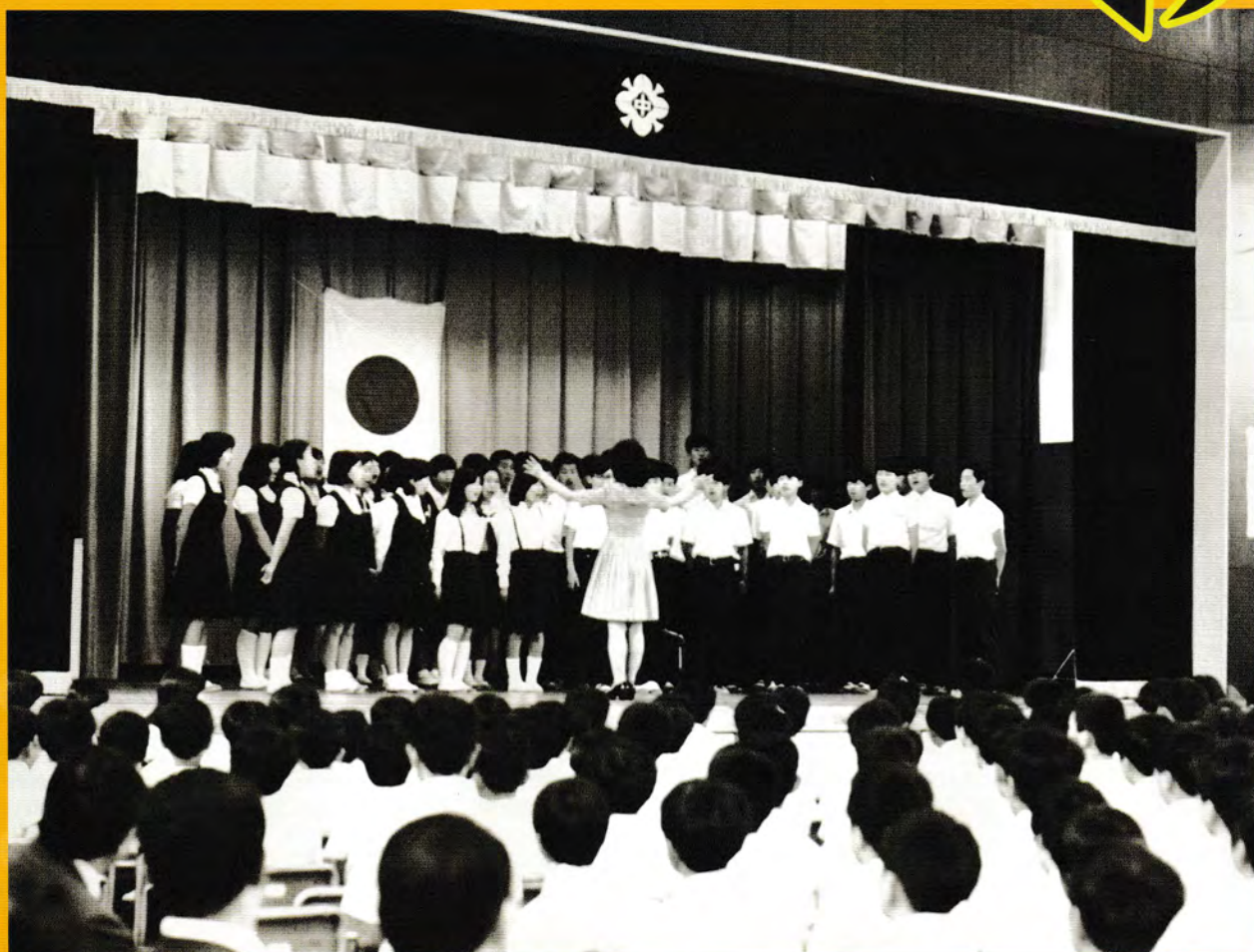
練馬区立練馬東中学校 校歌制定式での合唱 昭和49(1974)年6月21日 練馬区立練馬東中学校蔵