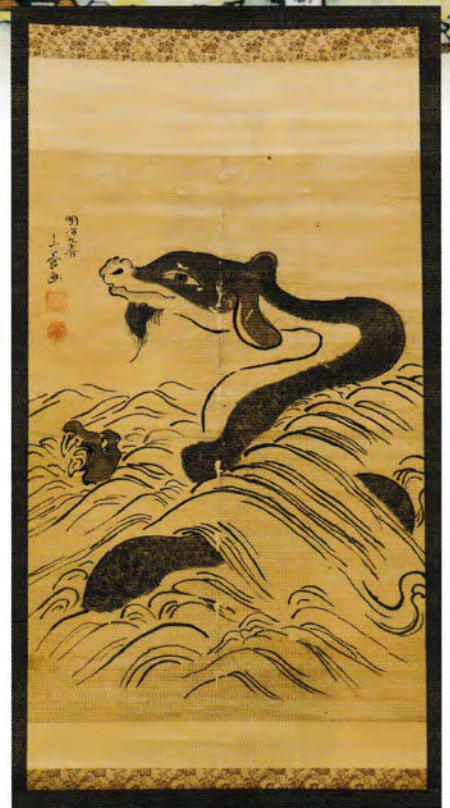
三寶寺池の主の図 明治9(1876)年 山養画 三寶寺蔵 古来より、三寶寺池には主がいると信じられていました。明治8(1875)年に山養という人物が、三寶寺池で「大龍」を見たという人からその様子を聞いて描いたという絵です。本図を掛けて折れば、干ばつの時に降雨がもたらされると言われてきました。