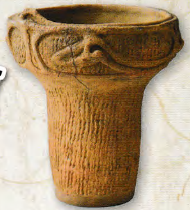
石神井出土の縄文時代中期の土器