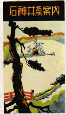
石神井名所案内 昭和8(1933)年 武蔵野郷土向上会が発行したガイドブックで、 表紙には三宝寺池が描かれています。

石神井は、練馬区内の地名で、都立石神井公園があることで知られています。三宝寺池の湧水や石神井川の流に恵まれた地であり、人びとが水と関わりながら暮らしてきました。水の恩恵を受けて、旧石器時代から人々の生活が営まれ、中世には、石神井川流域に勢力を拡大した豊島氏によって石神井城が築かれました。近世になると、江戸近郊農村として発展するとともに、三宝寺池周辺は風光明媚な場所として、江戸の文人にも知られるようになりました。枯れることなく湧き出る水源である三宝寺池にまつられた弁天社(現巖島神社)は、石神井川下流の人々から信仰を集め、祭礼時には江戸から訪れる人々で賑わいました。また、三宝寺池には主がいると信じられており、伝説も伝わっています。