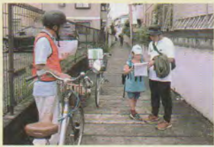
暗渠の上でコマ図を確認

子供は最初こそ乗り気ではなかったものの、コマ図を頼りに進んでいくのが段々と面白くなってきたようでした。クイズを通してまちを観察することもでき、いつも何気なく通り過ぎていた場所に裏道や暗渠や祠など、先人の営みを感じる事ができました。