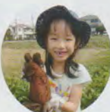
大きなサツマイモ

土の中から色鮮やかな紅色のサツマイモが顔をのぞかせると「わあ！」「大きい！」と歓声があがりました。自分の顔より大きなサツマイモを手にとった子供たちは、ご満悦な表情でたくさん見られました。 大きなサツマイモ ご満悦な表情の子供たちの姿がたくさん見られました。 大泉の豊かな自然の中で土と触れ合い、実りの秋を体感するひとときとなりました。