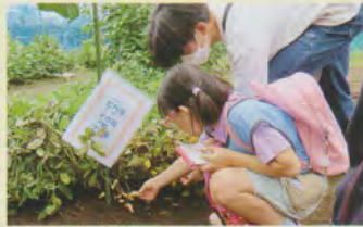
初めてみた落花生

を出してくれたり、ゴールすると採点してくれたり、集計の待ち時間にはポッチャ体験をさせてくれたり、とポットワークよく動いていて感心しました。子供たちはこのポッチャ体験をウォークラリー同様に楽しんでいて、飽きないよううまく設定してくださってありがとうございました。 いま、中々やらない順位付けも賞状も子供たちはとても嬉しそうに受け取っていました。秋らしいお花のお土産も素敵で、よい思い出になりました。