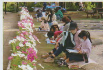
コスモスの花壇の前で

朝まで降り続いた雨もやみ、秋らしい肌寒さの中、総勢93名の参加者が大泉交通公園に集まりました。広い公園内で皆、思い思いの場所を選び、シートを敷き、画板を握りしめて写生開始です。