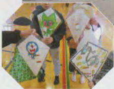
すてきな凧ができました