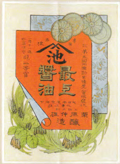
栗原醤油店 醤油樽ラベル 明治43(1910)年