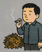
●燃えやすい物の近くでの喫煙

2025年2月に発生した岩手県大船渡市の大規模林野火災を受け、国により検討された結果、林野火災多発期（1月から5月）に一定の気象条件に達した場合、「林野火災警報」や「林野火災注意報」を発令し、発令中の「屋外における裸火で火の粉が飛散する行為」を制限することで、林野火災予防の実効性を高めることが必要とされました。