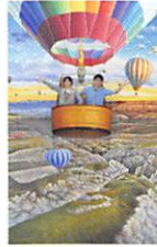
カッパドキアの夢景色