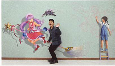
飛び出す魔法少女