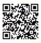
当館ホームページ内 イベントページ

講師：浜田弘明（桜美林大学教授） 日時：2月24日（土）14時～15時30分 会場：石神井公園ふるさと文化館 1階多目的会議室 定員：90名（抽選） 参加費：無料 申込：往復はがき、またはHP申込フォームにて ①イベント名 ②氏名（ふりがな、2名まで） ③住所 ④電話番号を記入の上、石神井公園ふるさと文化館へ。 申込締切：1月24日（水）必着