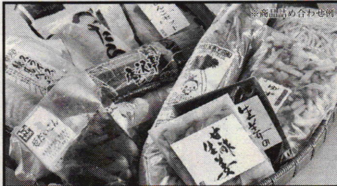
※商品詰め合わせ例