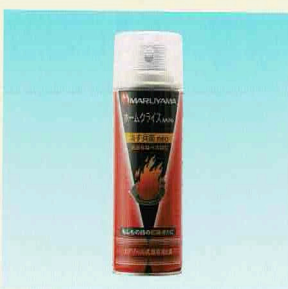
⑤エアゾール式簡易消火具 消す兵衛neo(使用期限3年)