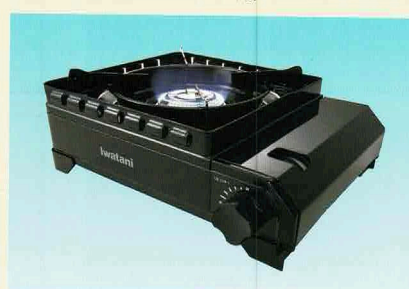
⑥イワタニカセットフー(タフまる)