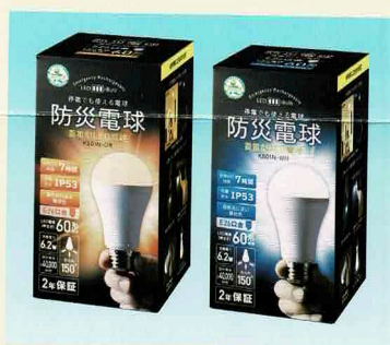
②防災電球(電球色/昼白色)