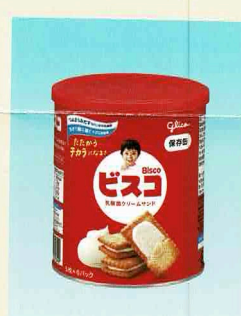
③ビスコ保存缶(5缶) (賞味期限5年3ヶ月)