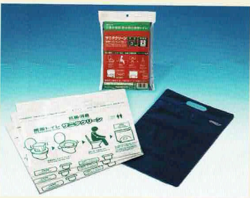
⑤サニタリン・簡単トイレセット 3枚入(2セット)(密閉式収納袋付)