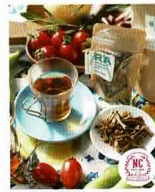
〈株式会社 REDD〉 アスバラガスほうじ茶「緑葉茶」

春のバラに囲まれて、武蔵野音楽大学のみな さまによる、華やかなサクソフォンの音色を お楽しみください。