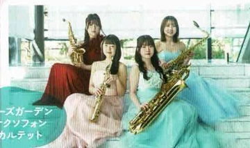
ローズガーデン サクソフォン カルテット