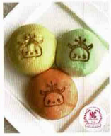
〈ホチキスデザイン工房〉 中島 真ん