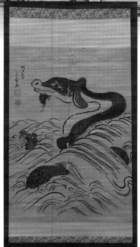
三正寺池の主の図 明治9(1876)年 山養画 三正寺蔵 古来より、三正寺池には主がいると信じられていました。明治8(1875)年 に山養という人物が、三正寺池で「大龍」を見たという人からその様子 を聞いて描いたという絵です。本図を掛けて折れば、干ばつの時に 降雨がもたらされると言われてきました。