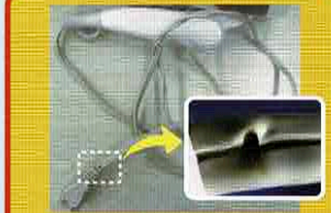
ドライヤーのコード