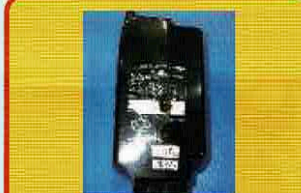
自転車用バッテリー