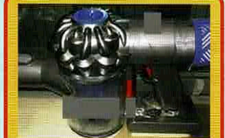
掃除機用バッテリー