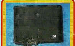
モバイルバッテリー