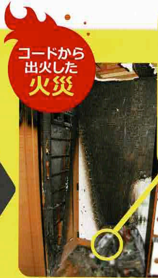
コードから 出火した 火災