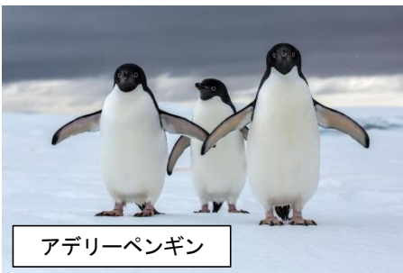
アデリーペンギン

ところで、このICカードが登場して以来、ずっと人気を誇っているのが、そのシンボルキャラであるペンギンです。しかし、このペンギンに愛称はありません。なぜなのでしょう。